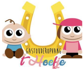
Gastouderopvang 't Hoefje