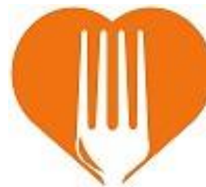
Voedselbank Utrecht Kanaleneiland