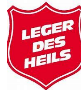
Leger des Heils Rotterdam