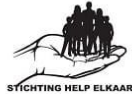
Stichting Help Elkaar